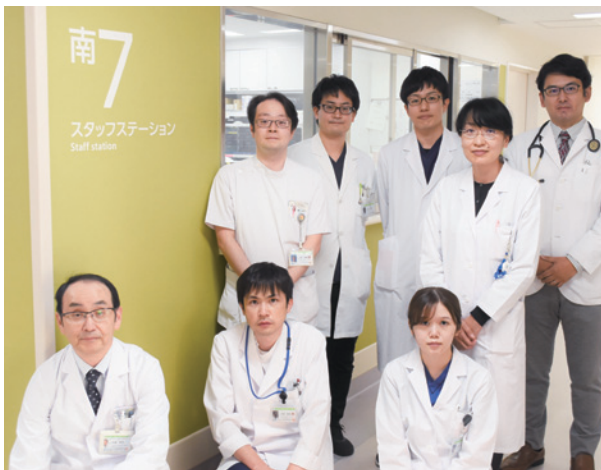
内分泌代謝内科スタッフ