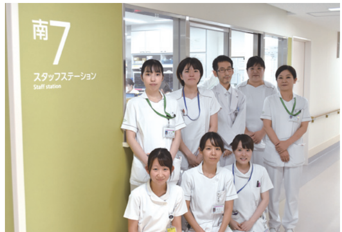
南病棟7階スタッフ